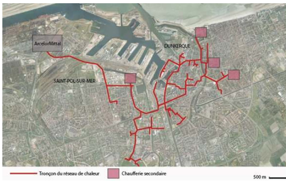
Figure 1. Organisation spatiale du réseau de chaleur de Dunkerque

pour fonction de rehausser la température du flux issu de la captation lorsque nécessaire, les autres sont des compléments de production dont la localisation est choisie dans le but de mailler spatialement le territoire desservi par le réseau (voir figure 1) 9 .